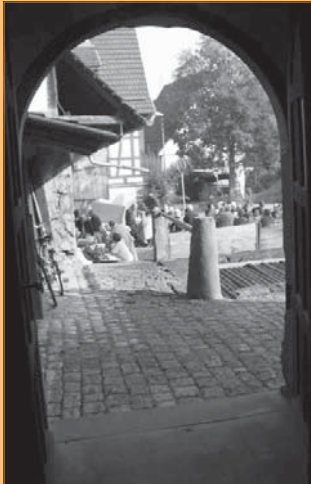
Durchblick vom Wohnhaus zur Scheune