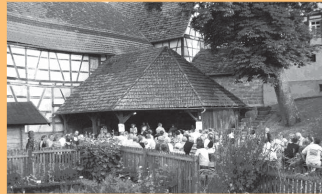
Hocketse im Garten