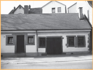
Backhaus und Schmiede